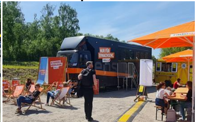
Radio eins im Aussengelände, nur für Erwachsene! (Wer kopiert da wen ? 😊)