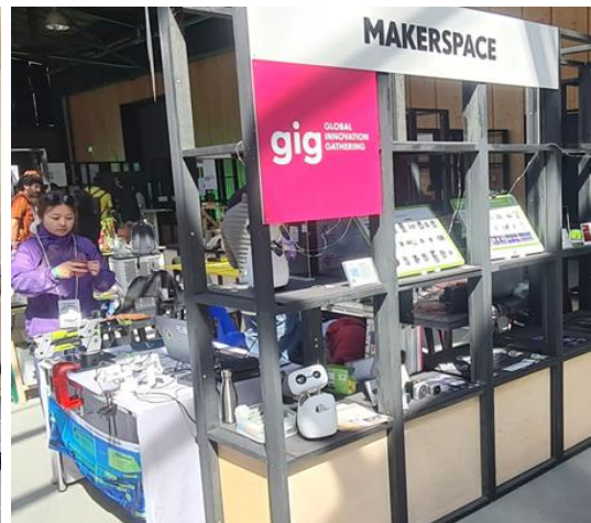
Hier kann man Abhängigkeit gegen Souveränität Tauschen! Und ein kleiner Startup Versuch 😊