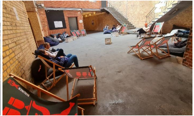
Eingangsbereich und «Liege-Bereich»: immer möglichst leger und einfach bequem