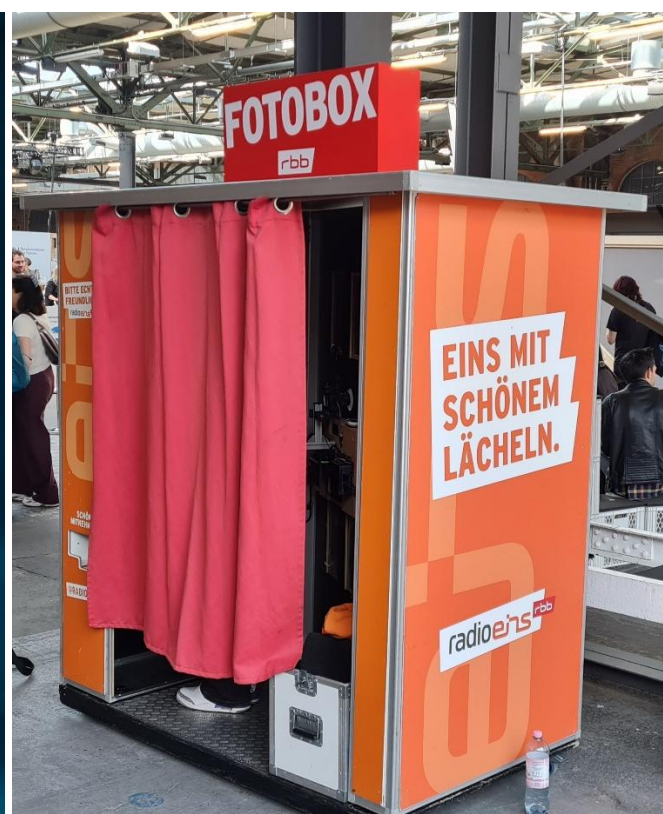
Radio eins ist überall