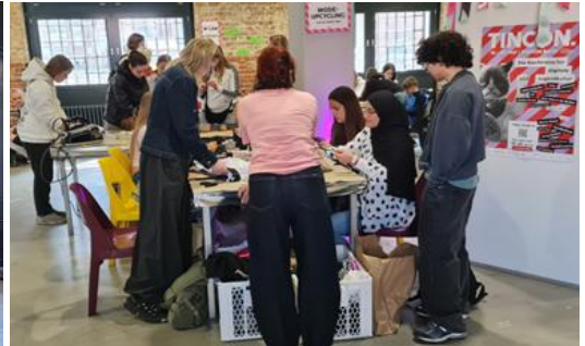
TINCON , die Konferenz für digitale Jugendkultur (im oberen Stock) Beispiel Mode-Upcycling und Workshop. Mehr zu TINCON hier .