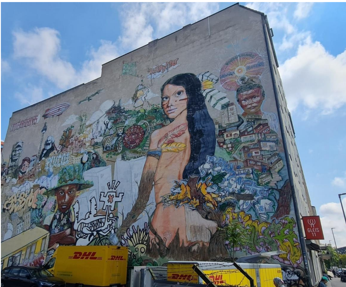
Riesige Wandmalerei direkt beim Eingang zur STATION