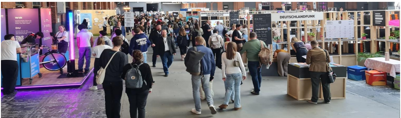
Auf dem Weg zur Hauptbühne