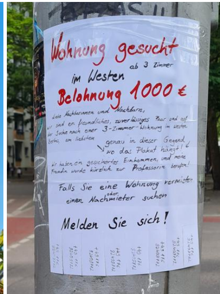
Wohnungsnot a la Berlin: Gesehen an einer Ampel im Bezirk Mitte