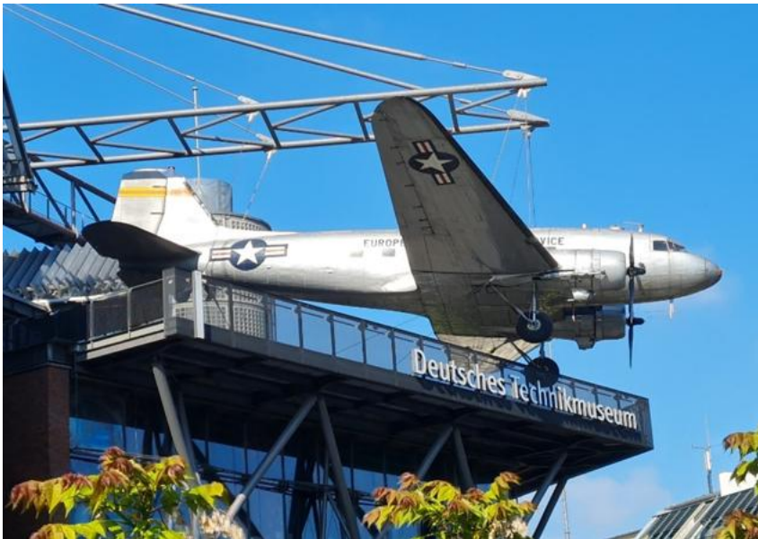
Als Rosinenbomber ( militärische Version der DC-3 ) wurden die Transportflugzeuge der westlichen Alliierten (USA und Grossbritannien) bezeichnet, die während der Berlin-Blockade (1948/1949) West-Berlin über eine Luftbrücke aus der Luft mit Lebensmitteln und Kohle versorgten. Hier ein Exemplar im deutschen Technik-Museum, direkt neben der Station Berlin, wo jeweils die RE-Publica stattfindet.