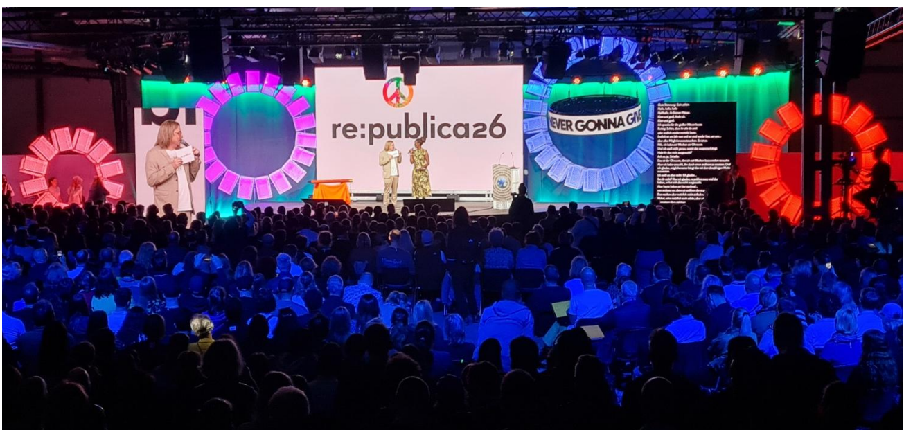
Full-House bei der Eröffnungsveranstaltung mit guter Veranstaltungsübersicht und den Headlines