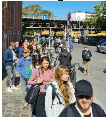
Uff...ganz vorne geht es rein....Blick zurück, die stehen ja bis zur U-Bahnstation Gleisdreieck!