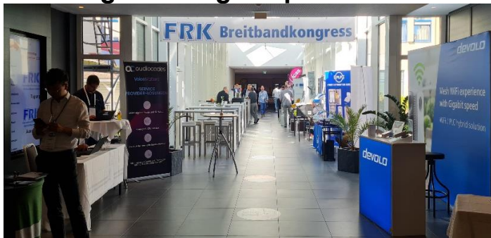
Lobby/Eingang zum FRK Breitbandkongress