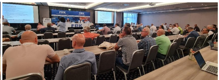
Interessenten offene Mitglieder-Versammlung mit rund 50 aktiven Zuhörern