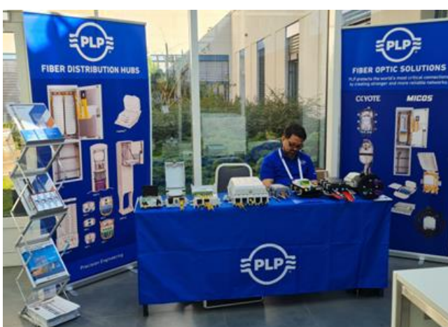
Nicht nur SOFTWARE und Dienstleistungen, sondern viel Hardware! Inkl. 5G gab es da zu sehen 😊