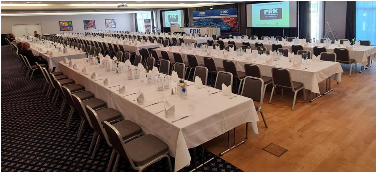
Alles bereit für den gemütlichen Branchen-Anlass am Abend des ersten Tages