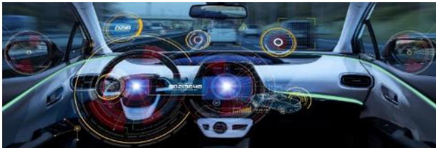
The Future of Content Management Radiodays EUROPE 2023 In Connected Cars Tech Insights March 2023

kämpfen haben aber keinerlei Interesse an DAB+ und 5G Broadcast. ( So hat der Kongress-Abgeordnete Josh Gottheimer soeben die National Highway Traffic Safety Administration aufgefordert, „AM-Radio zu den Federal Motor Vehicle Safety Standards hinzuzufügen, um zu verlangen, dass alle Autohersteller, einschließlich EV-Hersteller, AM-Radio als serienmäßige Funktion in ihre Fahrzeuge aufnehmen.