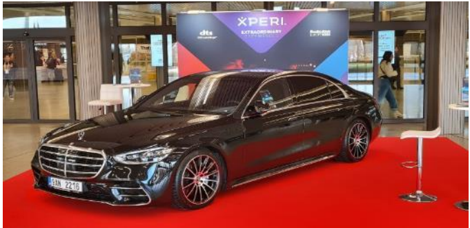
Die Millionen Dollar Frage: Where did the Radio Button go? (An XPERI ist kein Vorbeikommen ?) Mehr dazu hier .