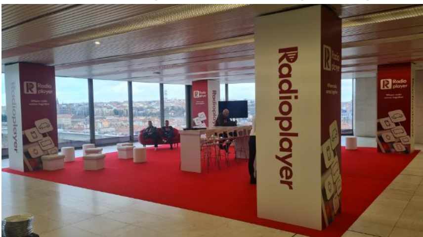
Radioplayerlaunch, der grösste Stand am RDE23