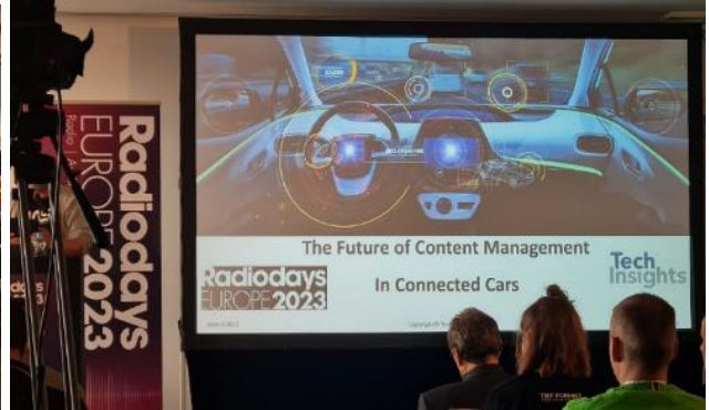
Voll-besetztes Haus beim Thema Audio-Messung der Zukunft und bei IN-CAR Entertainment