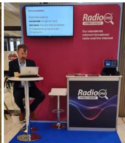
Fast einsam: Damon Hill (verlässt die Szene)