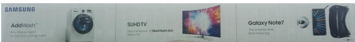
Gutes Beispiel eines Vollsortimenters von Waschmaschine bis Handy (Aussenwerbung)