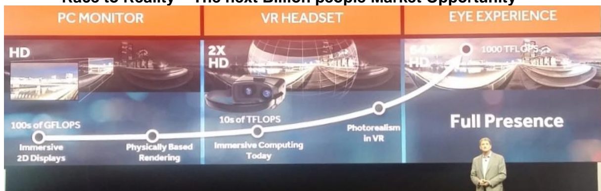
Eindrückliche Keynote Präsentation zu VR-AR des AMD CTO's Mark Papermaster