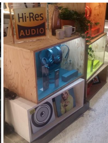
IFA- Vielfalt: Auferstehung des Plattenspielers neben Hi-Res Audio Angebot