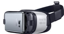
SAMSUNG GEAR VR

Die aktuellen, und wohl auch noch eine Weile bleibenden, Marktführer für VR Brillen