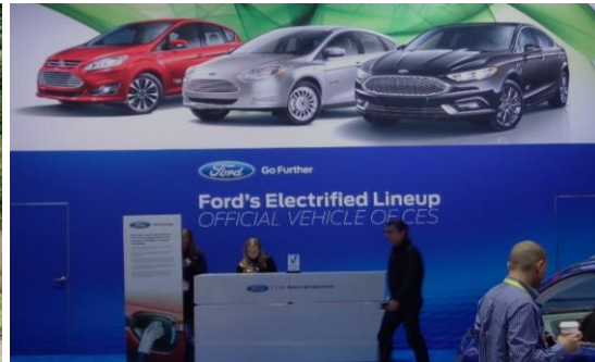
Testfahrzeug mit typischem Testaufbau Ford mit Grossaufgebot an der Messe