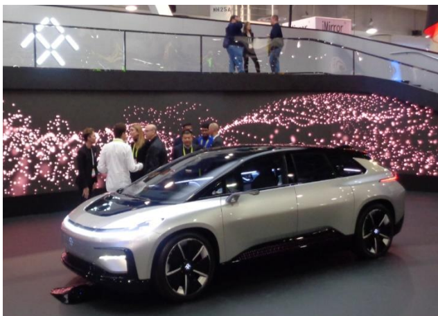
Faraday FF91, vorgestellt an der CES 17

BMW zum Beispiel, hat das Bedienkonzept Holoactive Touch das auf Gestensteuerung basiert vorgestellt. Gesamthaft hat die Technik im Auto inzwischen die Komplexität einer Kampfflugzeugausrüstung erreicht!