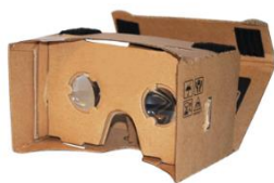
iPhone GOOGLE CARDBOARD

Das echte Wachstum von VR-AR und MR wird wahrscheinlich von industriellen Anwendungen kommen, welche die Finanzierung der Weiterentwicklung für den Consumermarkt ermöglichen sollen. Mindestens hoffen das die Marktbeobachter und Analysten.