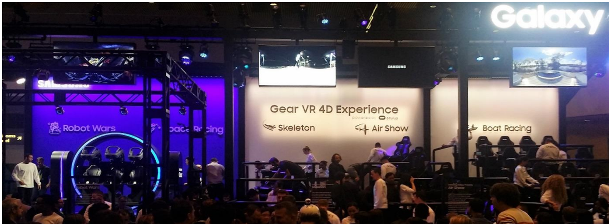
Eine der vielen Live-Demos zu VR, hier in grossem Stil von Samsung Galaxy